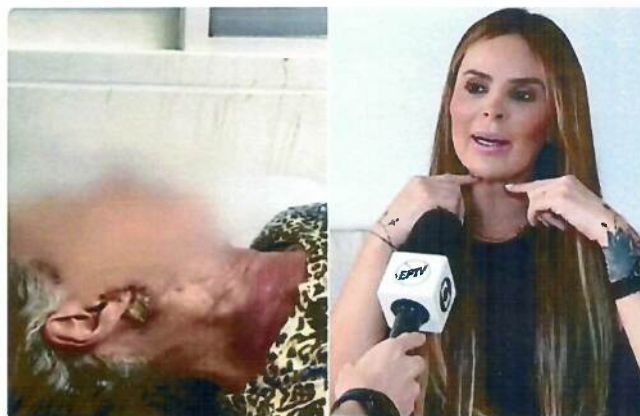
Mãe de influencer de São Carlos é hospitalizada após cirurgia estética irregular