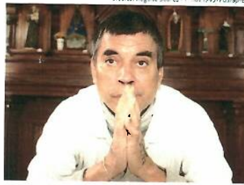
João Acácio Pereira da Costa, o Bandido da Luz Vermelha, em 1995, três anos antes de ser solto